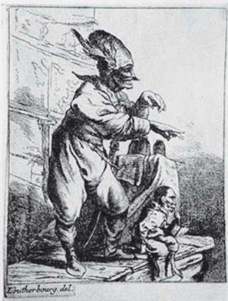
Der Scharlatan. Radierung von Louthembourg. Anfang 18. Jahrhundert

Wie der Arzt an der Krankheit und ihren Symptomen erst das Gesunde ganz erkennt, so wird der um das Verständnis der Massenpsychologie Bemühte aus der Masche der Volksbetrüger besser und klarer erkennen, welche Mittel die Masse zu ihrer Lenkung und Beherrschung gerne angewandt sieht, als aus den Bemühungen redlicher Leute. Der Prototyp dieser Art Menschen ist der Scharlatan. Das genannte Buch nun läßt die bekanntesten Scharlatane wie Berr,