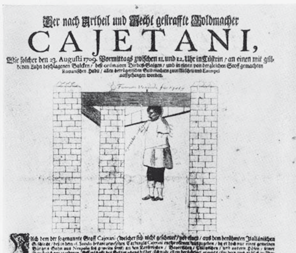
Fliegendes Blatt auf die Hinrichtung des Goldmachers Gaetano 1709 in Berlin

Der große Scharlatan braucht eine belesene Jüngerschaft. Er gewinnt sie durch den Schein der Uneigennützigkeit, und indem er sich als Wohltäter der Mensch-