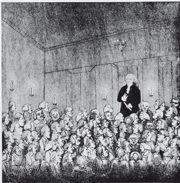
Der schottische Arzt James Graham (1745—94). Zeitgenössische Zeichnung von John Kay

Verantwortung für das, was er sagt und verkörpert, kennt er selbstverständlich nicht und lehnt sie aus Grundsatz ab. Er weiß, daß um so leichter die Suggestion zu erzeugen ist, je größer die Masse, zu der er spricht — ob er nun ein Mittel gegen Grünen Star oder einen Liebestrank anpreist. Die Vernunft darf ihre Stimme nicht erheben, sie ist seine größte Feindin, deshalb wird sie eingeschläfert, und die Freiheit, zu diskutieren und zu urteilen, wird durch stundenlange Reden gelähmt.