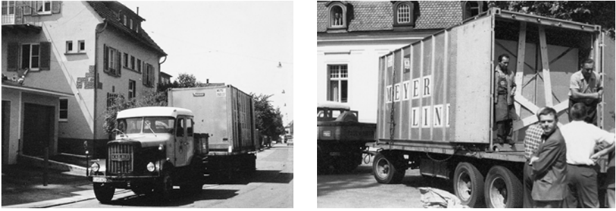
Abb. 6 und 7: Einzug der Bibliothek Pinthus in Marbach am Neckar, 1967

zu dieser Zeit darin angebracht. Obwohl diese Maßnahmen Pinthus' privater Praxis entgegenstanden, die Bücher möglichst von solchen irreversiblen Kennzeichnungen zu verschonen, untermauern die gedruckten Provenienznachweise, dass es ihm gelungen war, sein »Kunstwerk einer Bibliothek« vor einer Zerstreung in alle Winde auch nach seinem Tod zu bewahren.