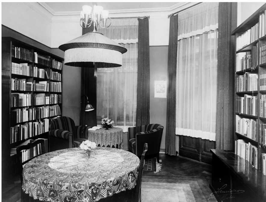
Abb. 4: Berliner Arbeitszimmer von Kurt Pinthus (Wohnbereich).

Ein drittes Wohnungsporträt zeigt das Schlafzimmer, ausgestattet mit wenigen Graphiken (ganz blass ist ein weiblicher Rückenakt zu erkennen) und einer Handvoll Bücher auf dem Nachttisch (Abb. 5).