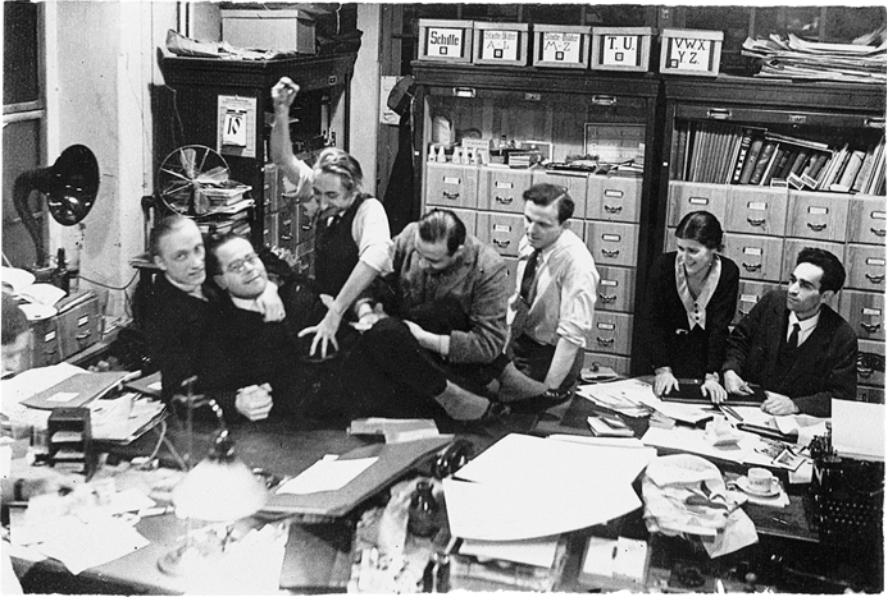
Abb. 1: Kurt Pinthus mit seinen Kollegen im Büro des 8 Uhr-Abendblatts , Januar 1931, DLA Marbach

Erst eine Berücksichtigung der Autorenbiographie vermag in diesem Fall die gravierendste Transformation im Leben der Autorenbibliothek zu erhellen. 6