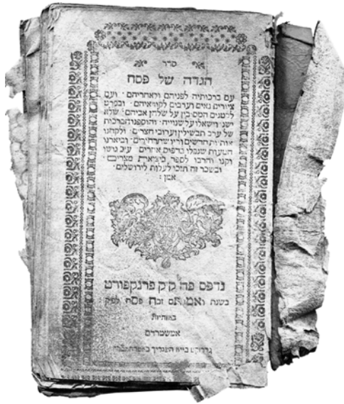
Abb. 2: Haggada shel Pesah , Frankfurt 1749, Niederzissen, Gefra-17

nisses anlegte. Es sind schlichte Stauräume, die sicherstellen sollen, dass die hinterlegten Residuen nicht in falsche Hände gelangen. Hinter dem Brauch steht also nicht die Wertschätzung eines Objektes, sondern der Schutz eines immateriellen Gutes, des Namens Gottes. Dies erklärt z. B., warum man die in eine Genisa gelegten Schriften und Bücher nicht vor Mäusefraß oder Wurmbefall schützt. Öffnet ein Forscher eine Genisa und erschließt die in ihr erhaltenen Zeugnisse, stellt dies im Übrigen kein Sakrileg dar. Trotz ihrer eigentlichen Funktion als Buchablagen sind Genisot nicht mit Pharaonengräbern zu vergleichen, die mit Flüchen gegen diejenigen versehen wurden, die sie öffnen.