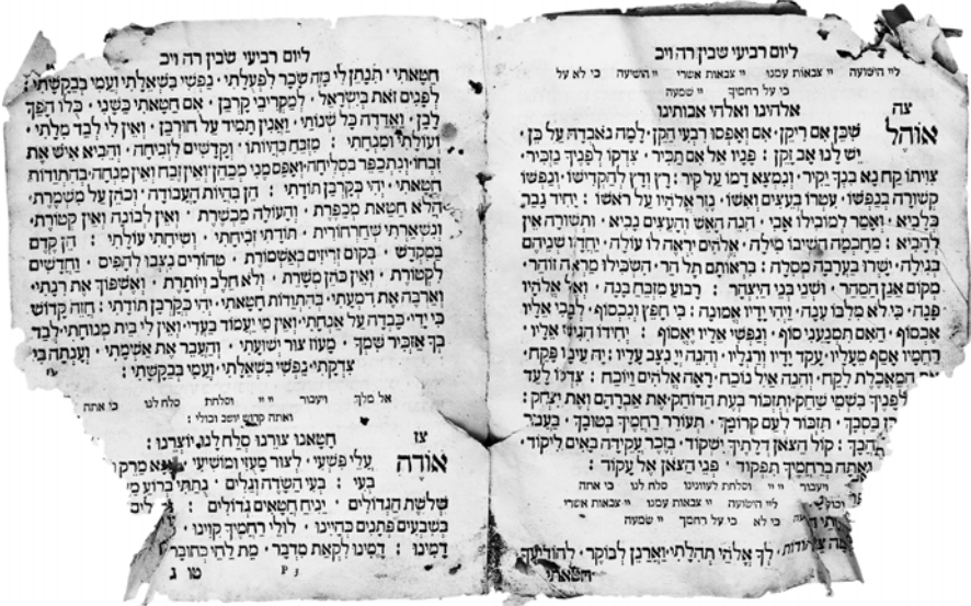
Abb. 4: Machsor Rosh ha-Shana – Yom Kippur , o.J., aus der Genisa Alsenz, ohne Signatur

Schriften – diesmal jedoch in Buch- und Akteneinbänden – in Deutschland übertragen wurde. In der Genisa der Synagoge von Weisenau bei Mainz fand sich etwa ein Bucheinbanddeckel, der in eine Psalmen-Handschrift aus dem 15. Jahrhundert eingeschlagen war. Dieser Fund bildet eine schöne Brücke zwischen zwei eigentlich sehr unterschiedlich begründeten Phänomenen. 14 Auch hebräische Einbandfragmente wurden offensichtlich in eine Genisa abgelegt.