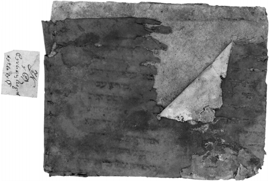
Abb. 5: Psalmenhandschrift auf Buchdeckel, Genisa Weisenau, Signatur WE 213