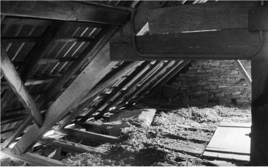
Abb. 1: Dachstuhl der Synagoge Niederzissen mit Genisa