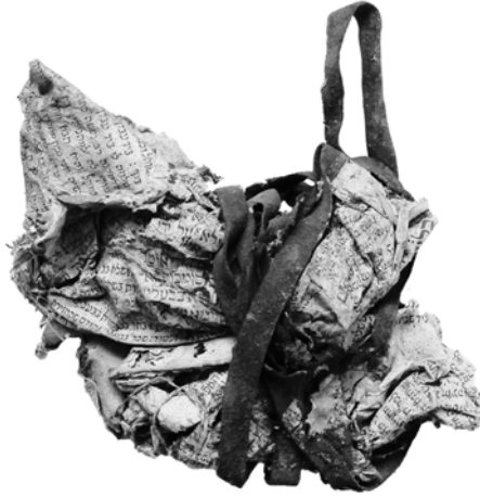
Abb. 3: Tefillin aus der Genisa Alsenz, zu einem Bündel gebunden

auf weitere Gegenstände übertragen. In einer Baraita im Traktat Megilla 26b, der sich unter anderem mit dem Verkauf heiliger Sachen befasst, werden zu Gebotszwecken verwendete Gegenstände (›Tashmische mitswa‹) aufgezählt, die entsorgt werden dürfen. Unter diese für kurze Zeit verwendete Gegenstände zählen der Feststrauß (›Arba‘a minim‹) für das Hüttenfest (›Sukkot‹), das Shofar-Horn und die Tsitsit, die, werden sie nicht mehr benötigt, weggeworfen werden dürfen. Unter ›Tashmische qedusha‹ (für dauerhafte heilige Zwecke verwendete Gegenstände) führt die ›Gemara‹ dagegen Behälter für ›Sefarim‹ (Tora-Rollen), ›Tefillin‹ und ›Mesusot‹, aber auch Hüllen und Futterale und die Riemen der Phylakterien auf. Diskutiert wird in diesem Zusammenhang auch der Umgang mit einem Tora-Vorhang (›Parokhet‹) oder mit Kisten für heilige Schriften und mit abgenutzten Hüllen von heiligen Büchern, die man aufbewahren bzw. nicht fortwerfen sollte. Frühe mittelalterliche Kommentare zum Traktat Megilla lassen mittels Übersetzung einiger seltenerer, zum Teil schlecht überlieferter hebräischer Termini in der Gemara durch deutsche und altfranzösische Wörter weitere Interpretationsmöglichkeiten des Genisa-Gebotes zu. 8