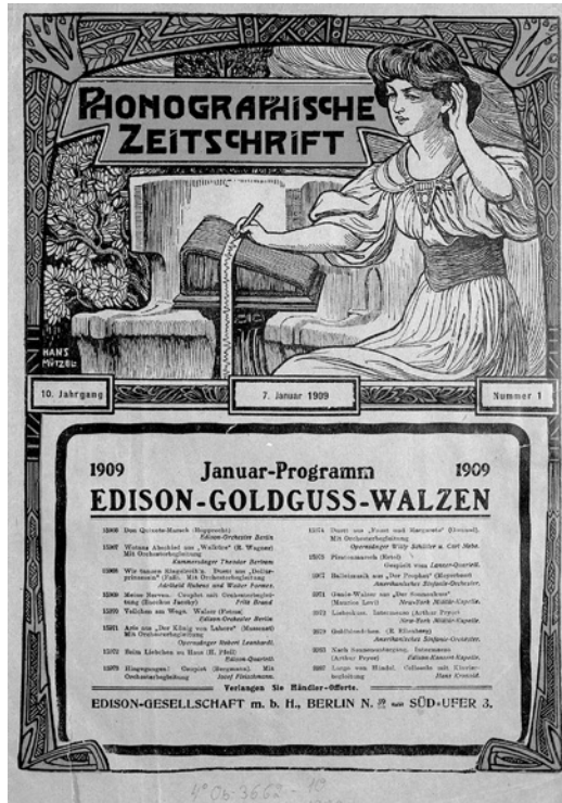
Abb. 2: Titelblatt der Phonographischen Zeitschrift, 1909, Hans Mützel, Reichsverband des Deutschen Sprechmaschinen- und Schallplattenhandels.

Ein unbekannter fränkischer Meister lässt den Engel den Gruß an Maria, das Ave Maria , sprechen, die Richtung der Botschaft ist unidirektional und führt vom Engel zu Maria, die buchstäblich empfängt. Um den Vorgang zu verdeutlichen, lässt der Maler aus der oberen linken Bildecke einen weißbärtigen Gott drei Strahlen aussenden, auf denen ein nacktes Menschlein in den Kopf Mariens schwebt. Diese Metapher der Transformation des gesprochenen Wortes in die Materialität der Leiblichkeit des Kindes greift das Titelblatt der Phonographischen Zeitschrift auf, indem erlauschter Schall durch Kopf und Körper einer Frau geleitet und mittels Schreibgeste wie als Schallplattenrille auf einem Papierstreifen materialisiert wird. Die Phonographische Zeitschrift mit dem Untertitel Fachblatt für die Gesamt-Interessen der Sprechmaschinen-Industrie und verwandter Industrien erschien von 1900 bis 1933 in Berlin