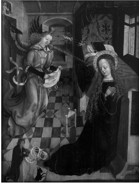
Abb. 1: Verkündigung, unbekannter fränkischer Meister, um 1480 (Domschatz- und Diözesanmuseum Eichstätt).

wonach das Wort an allem Anfang gestanden habe und dieses Gott selbst gewesen sei: »Ἐν ἀρχῇ ἦν ὁ λόγος, καὶ ὁ λόγος ἦν πρὸς τὸν θεόν, καὶ θεὸς ἦν ὁ λόγος.« 4 Martin Luther übersetzt: »IM anfang war das Wort / Vnd das wort war bey Gott / vnd Gott war das Wort.« 5 Entschiedener verhalten sich ikonografische Traditionen: Sie favorisieren den akustischen und auditiven Aspekt, wenn sie das Wort des Gottes als ursächlich für die Schwangerschaft der Gottesgebärerin Maria darstellen.