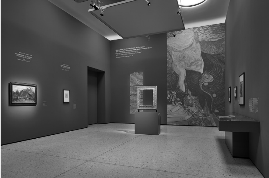
Abb. 2: Display »Bildnis des Dr. Gachet« der Ausst. MAKING VAN GOGH. Geschichte einer deutschen Liebe , Städel Museum, Frankfurt am Main, 2019.

einer Vitrine zu sehen. 22 Zusätzlich zu einem umfänglichen Vermittlungsprogramm thematisiert(e) ein eigens für die Ausstellung produzierter und noch heute abrufbarer fünfteiliger Podcast die Geschichte des Gemäldes und unterstreicht dessen zentrale Stellung für das Museum. 23 Auf der Suche nach dem Gemälde wird von der Entstehung des Werkes, seiner Erwerbung für