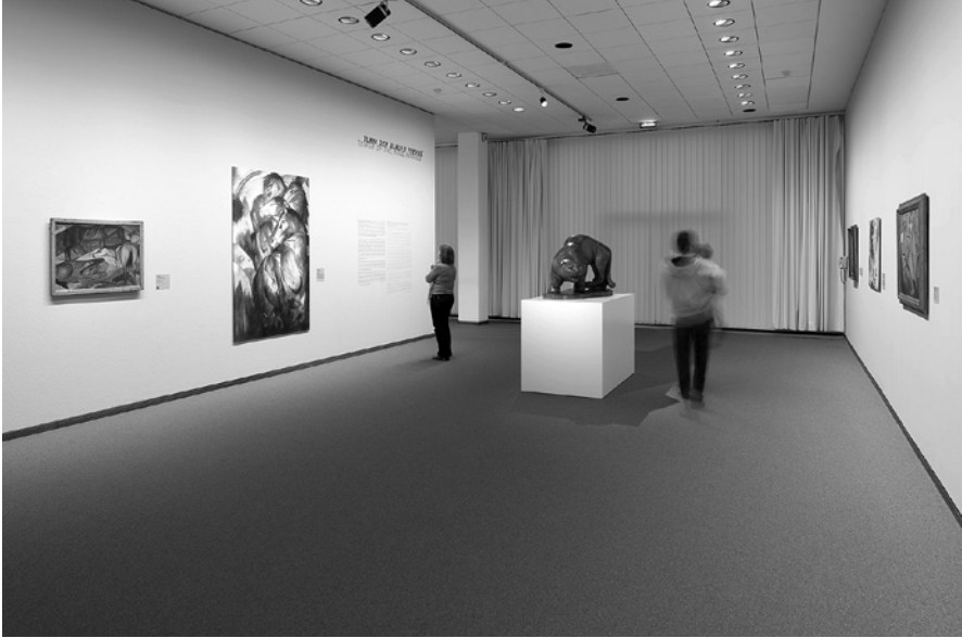
Abb. 5: Raumsicht Der Turm der blauen Pferde – Expressionismus als neue Romantik der Ausst. Moderne Zeiten , Neue Nationalgalerie, 2010.

Eine weitere Option des Zeigens von Abwesendem besteht darin, technische Hilfsmittel für Projektionen zu verwenden. Das Spektrum reicht von einer Lichtprojektion für das Gemälde Der Absinthtrinker von Pablo Picasso (1881–1973) in der Hamburger Kunsthalle in der Ausstellung Oscar Trowlowitz: Ein Leben für Hamburg im Jahr 2013 über Leuchtkästen in der Kunstsammlung Gera in der Präsentation Otto Dix: retrospektiv. Zum 120. Geburtstag 2011 bis hin zu einer VR-Installation im Kunstmuseum Moritzburg in Halle 2019. Unmissverständlich implizieren die letzten beiden Zeigevarianten, dass es sich dabei nicht um Originale handelt, sondern um Reproduktionen, die versuchen, einen Eindruck von den einstigen Werkqualitäten zu vermitteln.