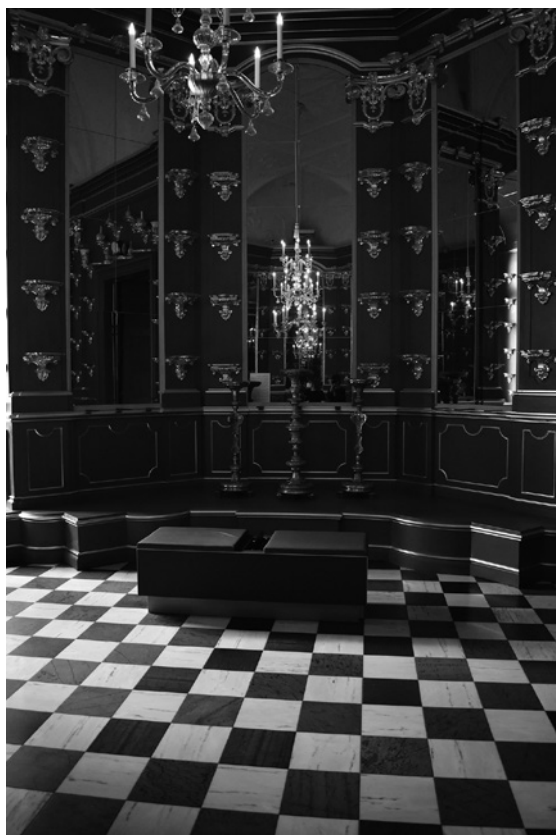
Abb. 4: Raumansicht Turmzimmer, Staatliche Kunstsammlungen Dresden, Residenzschloss, 2021.

Plünderung und Zerstörung nach Ende des Krieges 1947 nur ein dezimierter Bestand. 28 Um die Inszenierung des Raumes zu begreifen, sind Vermittlungsformate erforderlich: eine historische Aufnahme als Dokument der einstigen Ausstattung, Wandtexte, der Audioguide sowie eine Medienstation mit Filmmaterial.