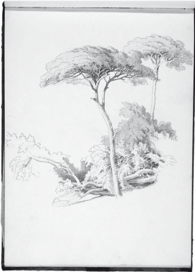
Abb. 5. Schirmpinien, Bleistiftzeichnung aus Maxes italienischen Skizzenbuch.

daher für die Reisegesellschaft von besonderem Interesse gewesen sein. Auf Maxes Zeichnung bilden sie eine helle Barriere zwischen dem hektischen Treiben der Händler auf der Piazza Caricamento und dem Gewirr der Masten im Yachthafen dahinter.