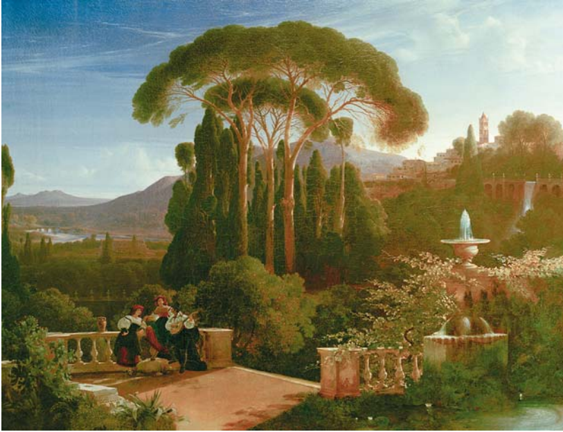
Abb. 8. August Wilhelm Ferdinand Schirmer, Aussicht von einer Terrasse der Villa d'Este, 1833 (Stiftung Preußische Schlösser und Gärten Berlin-Brandenburg, Berlin/Potsdam.

heute im Besitz der Preußischen Schlösser und Gärten befindet, lässt sich in seiner stimmungsvollen, lichterfüllten Atmosphäre unschwer als dasjenige identifizieren, das Maxe vor Augen stand. 60 Die Komposition, die in der Bildmitte von einigen hoch in den Himmel aufragenden Schirmpinien überfangen wird, zielt ganz auf Weite: Während das Auge in der rechten Bildhälfte bergan zu dem auf dem Hügel gelegenen Tivoli geführt wird, öffnet sich im linken Bildteil die Komposition und zieht den Blick über den Aniene hinweg bis zu den Bergen. An der Balustrade der Terrasse im Bildvordergrund lehnt ein Grüppchen bestehend