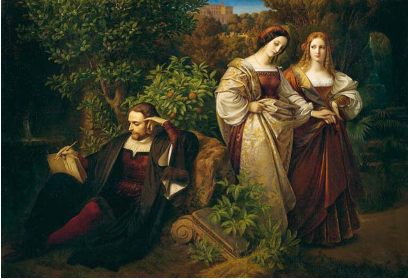
Abb. 9. Carl Ferdinand Sohn, Tasso an einer Quelle dichtend, belauscht von den beiden Leonoren, 1839 (Kunstmuseum Düsseldorf).

Mit Tivoli und Frascati 64 besuchte die Reisegruppe nicht nur die reizvollsten, bei Touristen bis heute wegen ihrer besonderen Mischung aus Natur- und Kulturerlebnis beliebten Ausflugsziele in der Umgebung Roms. Auch die Überreste der alten Etruskerstadt Veji, im Norden Roms, bei Isola Farnese gelegen, wurden eingehend besichtigt. 65 Überdies befolgte die Reisegesellschaft offenbar die in der zeitgenössischen Reiseliteratur ausgesprochenen Empfehlungen für die schönsten Spaziergänge innerhalb der Stadt und in ihrer unmittelbaren Umgebung, wie beispielsweise diejenige aus Försters Handbuch für Reisende in