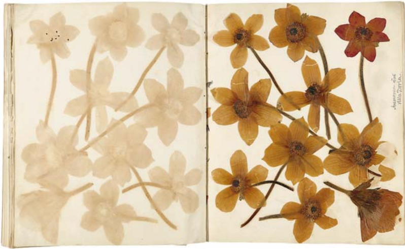
Abb. 10. Anemonen aus der Villa Doria Pamphili im Album der Maxe von Arnim.

langte (Blatt 43–61). Lediglich durch ein Zweiglein erfahren wir, dass die Gruppe auch dem Mühlthal im Hinterland von Amalfi – von allen Sehenswürdigkeiten wohl der Ort mit der jüngsten Entdeckungsgeschichte und dennoch um 1850 bereits fest im touristischen Kanon verankert – einen Besuch abstattete. 72