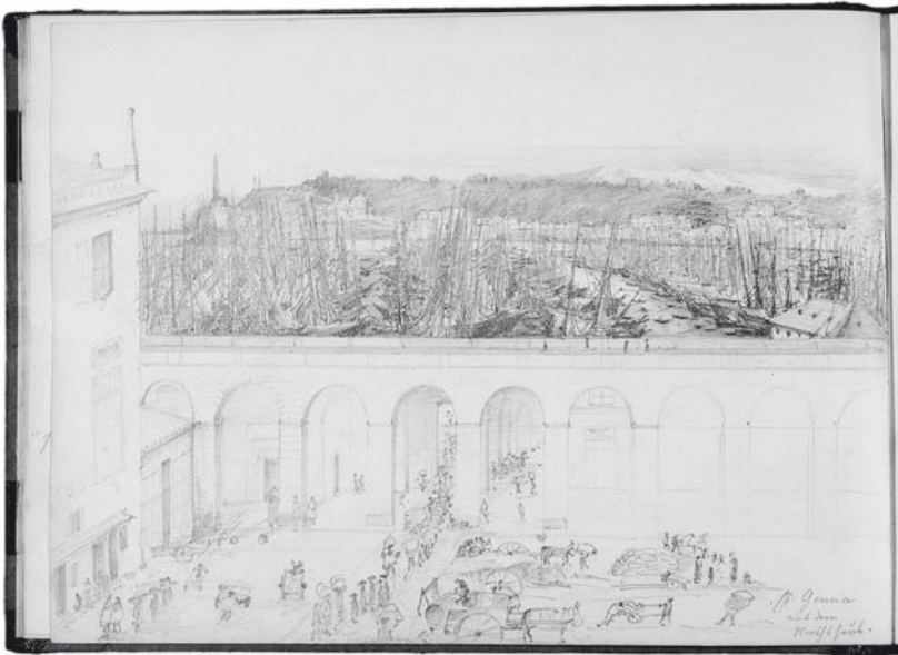
Abb. 4. Blick auf den Hafen von Genua, im Vordergrund die Piazza Caricamento und die Terrazze di marmo, Skizzenbuch der Maxe von Arnim, November 1851, Bleistiftzeichnung.

zeichnete Ansicht des Hafens von Genua (Seite 16 links; Abb. 4) zeigt von den mit festem Druck gezeichneten Masten der Segelboote bis hin zum weichen, teilweise gewischten Strich des Hintergrunds einen differenzierten Umgang mit dem Zeichenmittel, der auch ein Gefühl für die räumliche Wiedergabe der Ansicht offenbart. Die Ansicht muss aus einem Gasthaus in einem der an der Piazza Caricamento gelegenen Palazzi heraus entstanden sein 31 und erweist sich insbesondere in der ungewöhnlichen Zweiteilung, die die Terrazze di marmo erzeugen, als interessant. Diese überdachten Arkaden, die sich als Straße und Promenade mit 13 Metern Breite entlang dem Hafenbecken auf über 400 Meter Länge erstreckten, wurden erst 1844 eingeweiht und dürften