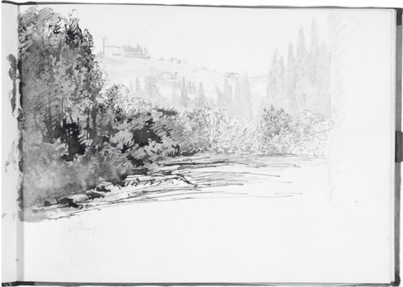
Abb. 3. Ansicht aus der Umgebung von Florenz, Skizzenbuch der Maxe von Arnim, November-Dezember 1851, Feder und Pinsel in Braun über Bleistift.

Sees entlang gelegen, sodann Torno mit der Villa Pliniana (Seite 8 links), die Villa Mylius Vigoni in Menaggio (Seite 10 links) oder die Villa Sommariva (Seite 12 links).