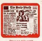
This is our daily world.