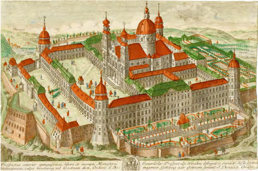
Abb. 1: Martin G. Crophius nach Friedrich B. Werner: Göttingen, 1737

Der Diarium -Bericht gehört zu den frühesten Nachrichten von der Fertigstellung der 1718 durch einen Brand schwer beschädigten und in den Folgejahren unter Abt Bessel neu errichteten Stiftsgebäude. 4