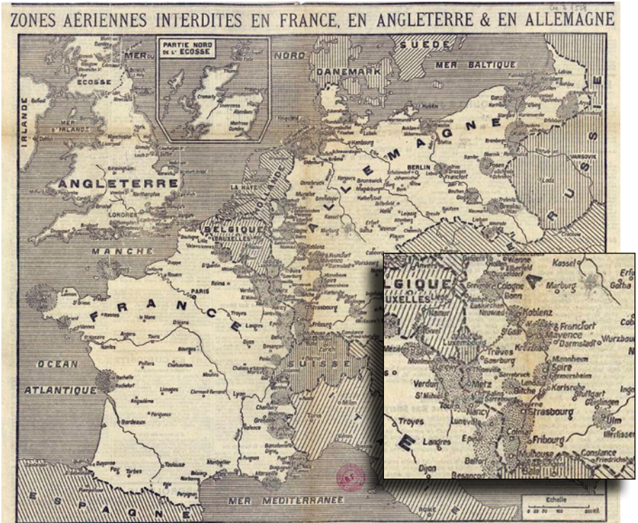
Abb. 2: Zones aériennes interdites en France, en Angleterre en Allemagne (Verbotene Luftzonen in Frankreich, England und Deutschland) [Die verbotenen Zonen sind gepunktet dargestellt].

Beilage »Le Temps«, 26. Oktober 1913, Bibliothèque nationale de France, http://ark.bnf.fr/ark:/12148/cb40703091j