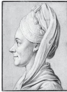
Abb. 5. Sophie von La Roche am 27. Juli 1774.