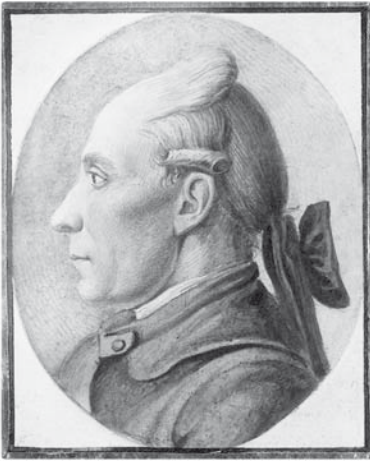
Abb. 13. Johann Konrad Deinet im Juli 1774.