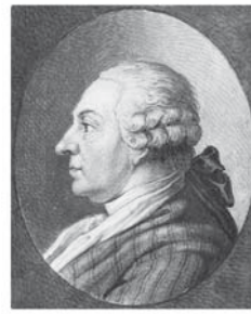
Abb. 9. Johann Caspar Goethe am 26. Juni 1774.

Abb. 23) bemerkte er: »alle kennbar, und doch alle verunedelt oder veraltert. Alle von demselben Zeichner gezeichnet, und aller Augenbraunen zu schwach und zu hoch über den Augen – und daher alle schwächer, weiblicher als die Natur.« 12