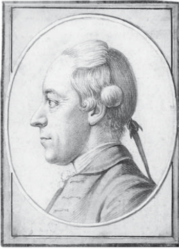
Abb. 15. Januarius Zick am 19. Juli 1774.