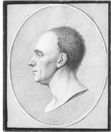
Abb. 14. Johann Bernhard Basedow am 13. Juli 1774.