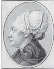
Abb. 8. Katharina Elisabeth Goethe am 25. Juni 1774.