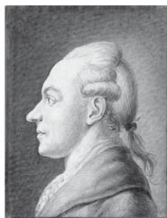
Abb. 19. Johann Heinrich Merck am 3. August 1774.