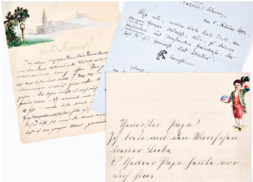
Abbildung 1: Eigenhändige Zeichnungen und Glanzbild

Gedicht Ich trete mit den Wünschen treuer Liebe in einem Gedichtbrief vom 25. September 1883 ist in diversen Publikationen zu finden, die diesen Markt bedienten (vgl. Abb. 1). Frühe Schriftzeugnisse von Rilke wurden demnach zwar aufgehoben, aber weder als Teil des lyrischen noch als Teil des brieflichen Werkkosmos betrachtet. In der Ausgabe der Briefe an die Mutter wurden Rilkes frühe Briefe nicht abgedruckt. Die Ausgabe setzt 1896 ein; überliefert sind aber ein auf den 24. Mai 1884 datierter und circa 25 undatierte Kinderbriefe sowie ungefähr weitere 160 Briefe aus den Jahren 1889 bis 1893.