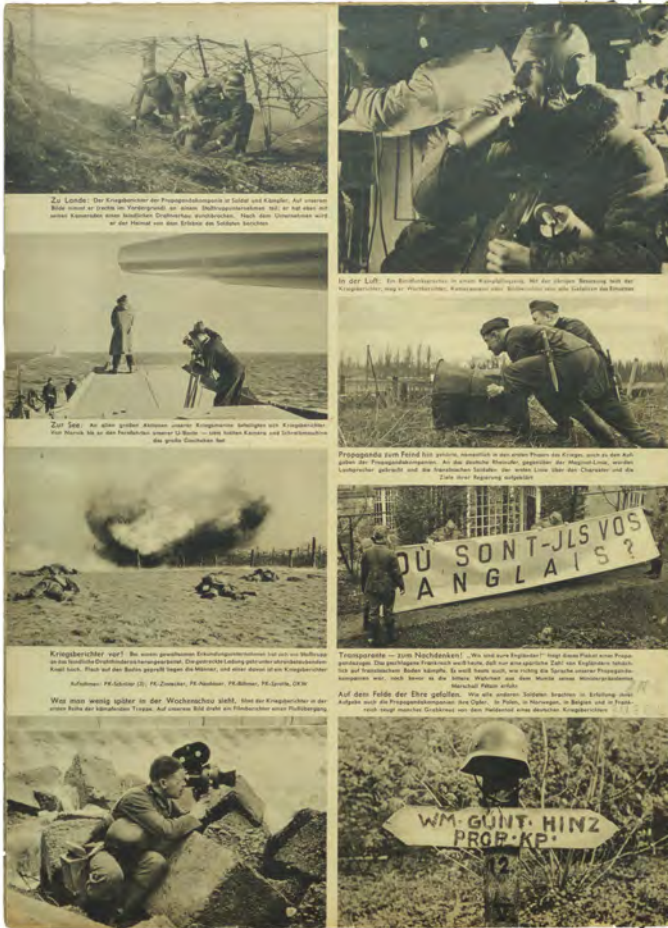
Abb. 3: Fotos erschaffen Helden. Angehörige der Propagandakompanien fotografierten den Kampf der Wehrmacht im Zweiten Weltkrieg. Sowohl der Wehrmacht als auch dem Reichsministerium für Volksaufklärung und Propaganda unterstellt, bestand ihre Aufgabe in der Heroisierung der deutschen Soldaten. Fotografisches Mittel waren Schnappschüsse auf Augenhöhe, die das Heldentum von Wehrmachtangehörigen im Kriegseinsatz authentisch bezeugen und zudem deutlich machen sollten: Die Fotografen befanden sich in derselben Situation wie die Fotografierten.