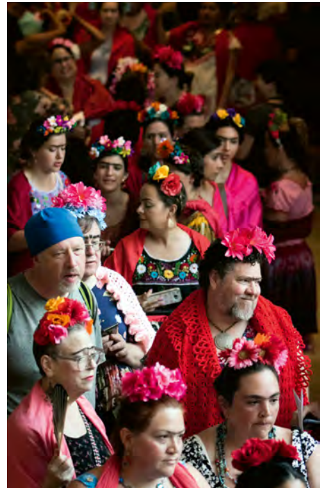
Fig. 5: Colourful clothes and flowery hairpieces create the heroine. To mark what would have been Mexican artist Frida Kahlo's 110th birthday in 2017, the Dallas Museum of Art called upon the public to dress up as Frida. Around 1,000 Frida Kahlo fans turned up with unmistakable characteristics: unibrows, lady beards, flowers in their hair and colourful clothing. Their shared admiration for Kahlo as a figure of identity also helped them feel a sense of belonging, strength and empowerment.

Abb. 5: Bunte Kleidung und Blumen im Haar erschaffen die Heldin. Anlässlich des 110. Geburtstags der mexikanischen Künstlerin Frida Kahlo rief das Dallas Museum of Art 2017 dazu auf, sich als Frida zu verkleiden. Rund 1.000 Frida-Kahlo-Fans erschienen mit unverkennbaren Merkmalen: zusammengewachsene Augenbrauen, Damenbart, Blumen im Haar und farbenfrohe Kleidung. Ihre gemeinsame Verehrung für die Identifikationsfigur Kahlo trug auch dazu bei, sich zusammengehörig, stark und »empowered« zu fühlen.