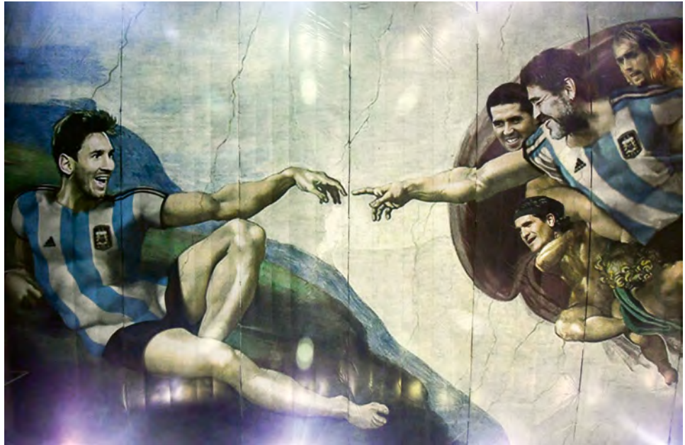
Abb. 1: Finger erschaffen Helden. Das Deckenkunstwerk in einer Trainingshalle des Sportvereins Sportivo Pereyra Club Barracas in Buenos Aires (2014) ist eine Adaption von Michelangelos Fresko »Die Erschaffung Adams«. Lässig liegt Lionel Messi gegenüber einer Gruppe weiterer argentinischer Fußballspieler, die sich um Diego Maradona scharen. Die abgebildeten Männer sind fit, stark und sexy. Die ausgestreckten Zeigefinger im Bild lenken die Aufmerksamkeit des Publikums jeweils auf Maradona und Messi und weisen beide als Helden aus.

Fig. 1: Fingers create heroes. This work of ceiling art in a training facility at the Sportivo Pereyra Club Barracas in Buenos Aires (2014) is an adaptation of Michelangelo's fresco "The Creation of Adam". Lionel Messi is casually seated opposite a group of Argentinian footballers gathered around Diego Maradona. The men depicted are fit, strong and sexy. The outstretched index fingers in the image draw the audience's attention to Maradona and Messi respectively and identify both as heroes.