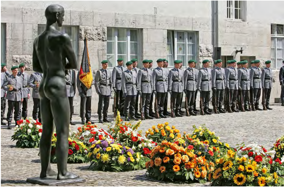
Abb. 9: Soldaten erschaffen den Helden. Im Hof des Berliner Bendlerblocks wurden Oberst Claus Schenk Graf von Stauffenberg und andere Beteiligte des Attentatversuchs auf Adolf Hitler noch in der Nacht des 20. Juli 1944 hingerichtet. Das Gedenken am Ehrenmal gehört heute zur Traditionspflege der Bundeswehr.

Fig. 9: Soldiers create the hero. In the Bendlerblock courtyard in Berlin, Colonel Claus Schenk Graf von Stauffenberg and others involved in the attempted assassination of Adolf Hitler were executed on the night of 20 July 1944. Today, commemoration at the memorial is part of the Bundeswehr's "Traditionspflege" (cultivating of tradition).