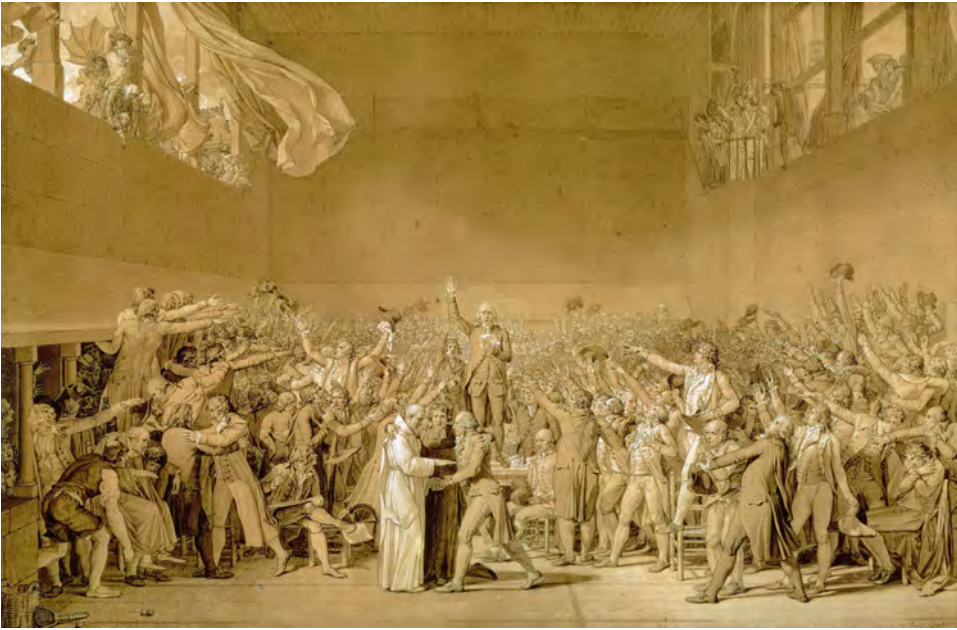
Abb. 2: Hände erschaffen Helden. Zentrale Figur in Jacques-Louis Davids Gemäldesentwurf zum Ballhauschwur von 1791 ist Jean-Sylvain Bailly, Präsident der französischen Nationalversammlung, der mit erhobener rechter Hand den Schwur verliest. Wie in einer gemeinsamen Bewegung richten die um ihn herum gruppierten Abgeordneten ihre Schwurhände auf ihn. Der Künstler medialisiert Bailly als heroischen Anführer und zugleich alle mit ihm im Schwur Vereinten als heroisches Kollektiv. Fig. 2: Hands create heroes. The central figure depicted in Jacques-Louis David's sketch of the Tennis Court Oath (1791) is Jean-Sylvain Bailly, President of the French National Assembly, who is reading out the oath with his right hand raised. As if in a united movement, the parliamentarians grouped around him direct their oath hands at him. The artist medialises Bailly as a heroic leader and, at the same time, all those united with him in the oath as a heroic collective.

that homosexuality is a difficult topic in football. Anyone who has seen pictures of Maradona knows that his physical appearance in the ceiling painting has been made to fit an ideal that he did not meet in real life. This beautification can augment a heroization – or make it seem less believable.