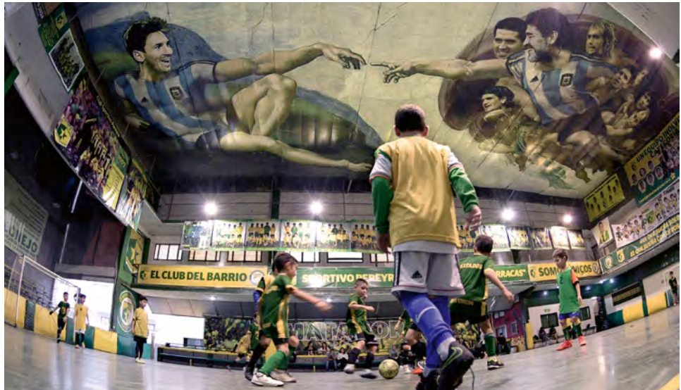
Abb. 7: Ein Sportverein erschafft den Helden. Indem das Deckengemälde Michelangelos Fresko »Die Erschaffung Adams« in der Sixtinischen Kapelle zitiert, wird die Sporthalle sinnbildhaft zu einem heiligen Ort des Fußballs. Diejenigen, die unter den Augen ihrer Helden trainieren, können sich inspiriert fühlen und darauf hoffen, irgendwann selbst in den Heldenhimmel aufgenommen zu werden.

Fig. 7: A Sport Club creates the hero. By referencing Michelangelo's fresco "The Creation of Adam" in the Sistine Chapel, this ceiling painting symbolises the sport facility as a sacred place for football. Those who train under the eyes of their heroes can feel inspired and hope to be accepted into "hero heaven" themselves one day.