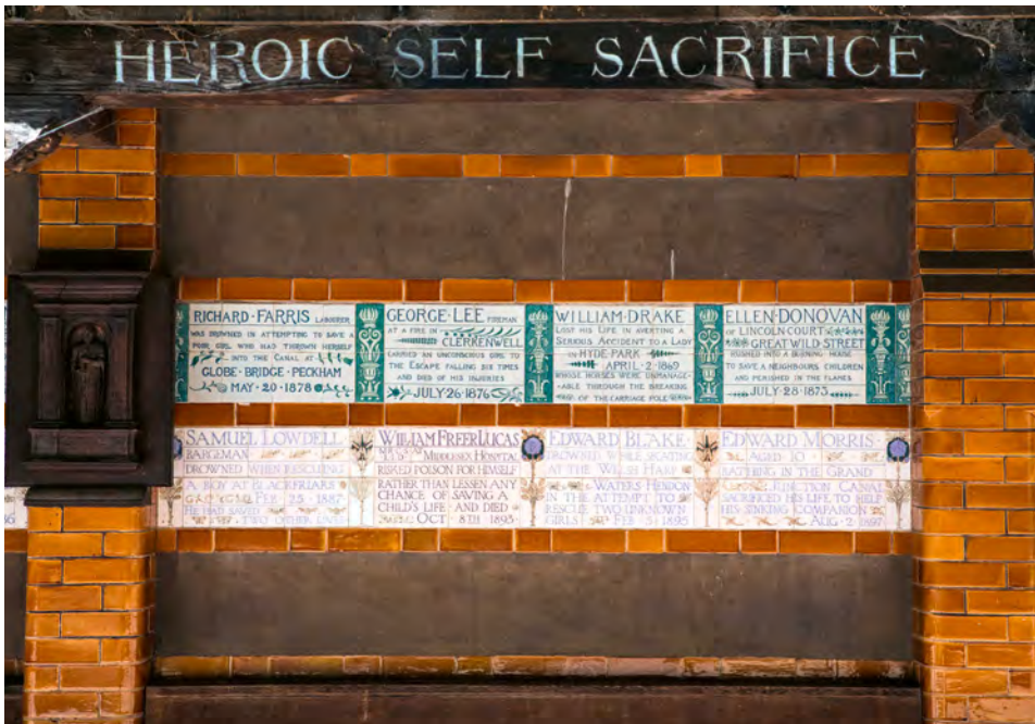
Abb. 4: Keramiktafeln erschaffen Held:innen. Auch eine bescheiden wirkende Wahl von Material und Form kann heroische Lesarten aufrufen. Das »Memorial to Heroic Self-Sacrifice« (1900) im Londoner Postman’s Park verankert Geschichten von Held:innen des Alltags im öffentlichen Raum: Statt Statuen erinnern schlichte Gedenktafeln ohne Bildnisse an »einfache« Menschen, die beim Versuch starben, andere zu retten.