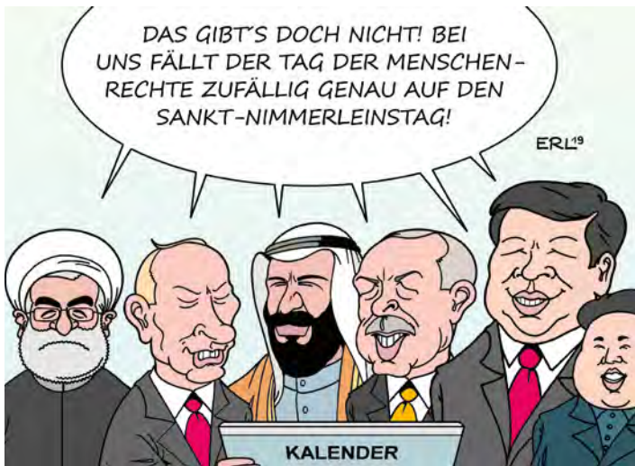
Abb. 4: Gemeinschaften gründen sich auf gemeinsame Werte oder Errungenschaften – oder auch, wie diese Karikatur von 2019 andeutet, auf das gemeinsame demonstrative Nicht-Teilen von Werten, die die Gegenseite für existenziell und unveräußerlich hält.

Fig. 4: Communities are based on shared values or achievements – or, as this 2019 cartoon suggests, on the common occurrence of not sharing values that the other side considers existential and inalienable. [Cartoon: “No way! Human Rights Day just happens to fall on “Saint Whosie-Whatsit’s Day”! (Suggesting that these politicians disregard human rights so much that they don’t even make the effort to pretend to acknowledge Human Rights Day.)]