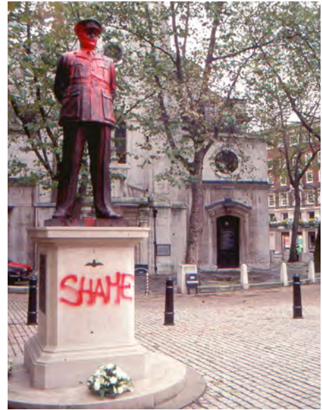
Abb. 8/9: Die Bilder zeigen Szenen von Mai und Oktober 1992. In Anwesenheit der Königinmutter festlich eingeweiht, war das Denkmal für »Bomber Harris« schon kurze Zeit später Ziel heftigen Protests. Auch wenn in Großbritannien kein Zweifel daran besteht, dass Arthur Harris zur Zeit des Zweiten Weltkriegs auf der »richtigen Seite« stand, polarisiert die Wahl seiner Mittel.

Fig. 8/9: These pictures show scenes from May and October 1992. The memorial shown, commemorating British Air Officer Commanding-in-Chief Arthur "Bomber" Harris, was inaugurated in the presence of Queen Elizabeth The Queen Mother, but soon became the target of fierce protests. Even though the most of the population in Great Britain believes that Harris fought for the "right side" during the Second World War, his choice of actions has polarised opinions.