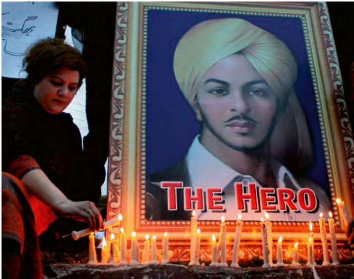
Abb. 10: Bhagat Singh gehörte zu einer Gruppe von drei jungen indischen Attentätern, die von der britischen Kolonialjustiz zum Tode verurteilt und 1931 hingerichtet wurden. Die drei waren 22 und 23 Jahre alt. Vor allem ihre Jugend und die schweren Strafen tragen dazu bei, dass sie bis heute in Indien und Pakistan als Freiheitskämpfer und Märtyrer verehrt werden, die angesichts eines übermächtigen Unrechtssystems das größtmögliche Opfer gegeben haben. Ihre Gewaltbereitschaft tut der Verehrung keinen Abbruch.

Fig. 10: Bhagat Singh was one of three young Indian assassins who were sentenced to death by the British Colonial Judiciary and executed in 1931. They were all between 22 and 23 years old. Their young age and harsh sentences are the main reasons why they are still honoured today in India and Pakistan – as freedom fighters and martyrs who made the greatest possible sacrifice in the face of an overpowering system of injustice. Their willingness to use violence does not diminish their veneration.