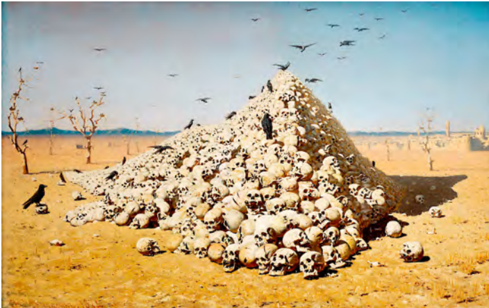
Abb. 5: »Apotheose des Krieges« nannte der russische Militärmaler Wassilij Wassiljewitsch Wereschtschagin sein 1871 entstandenes Gemälde: Auch ein siegreicher Eroberer wie Timur baut seine Zukunft auf Tod und Zerstörung auf. Das Gemälde ist ein Hauptwerk der Staatlichen Tretjakow-Galerie in Moskau. Als ein Mann in der sibirischen Stadt Tomsk im März 2022 mit einer Kopie des Bildes gegen den Einmarsch russischer Truppen in die Ukraine protestierte, wurde er festgenommen und anschließend zu einer Geldstrafe verurteilt.

Fig. 5: Russian military painter Vasily Vasilyevich Vereshchagin entitled his 1871 painting, dedicated to all great conquerors, "Apotheosis of War". Even a victorious conqueror like Timur based his future on death and destruction. This painting is a major work of art in the State Tretyakov Gallery in Moscow. In March 2022, a man in the Siberian city of Tomsk protested against the invasion of Ukraine by Russian troops with a copy of the painting; he was arrested and subsequently sentenced to pay a fine.