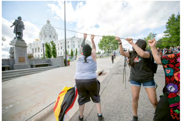
Abb. 7: Auch Helden haben ein Verfallsdatum. Christoph Kolumbus, seit Jahrhunderten als heroischer Entdecker verehrt, polarisiert die heutige Erinnerungskultur. Die in den Americas ansässigen Völker hatten Kultur und eine lange Geschichte, längst bevor sie von einem Europäer »entdeckt« wurden. Nicht nur Angehörige dieser Völker fordern eine kritische Neubewertung dieser »Entdeckung«, die millionenfaches Leiden und Sterben zur Folge hatte. Das Bild zeigt den Versuch, 2020 die Kolumbus-Statue in St. Paul (Minnesota) zu stürzen.

Besides the complete suppression of the victim's perspective, there is another form of the heroization of violent actions that remove them from polarisation within the hero's own community: That is to focus on the hero's commitment to a cause that is seen as having a moral value so high that it justifies sacrifices on both sides – particularly if the sacrifices are made by the heroes themselves. This largely applies, for example, to the retrospective evaluation of the actions of the Allies during World War II – although even in this case there were mixed opinions. Arthur Harris, the British Air Force Marshal also known as 'Bomber Harris', was not only criticised in Germany for the area bombing of German cities in 1945. He was also controversial in Britain because the Royal Air Force suffered heavy losses under his command. But for the admirers of 'Bomber Harris',