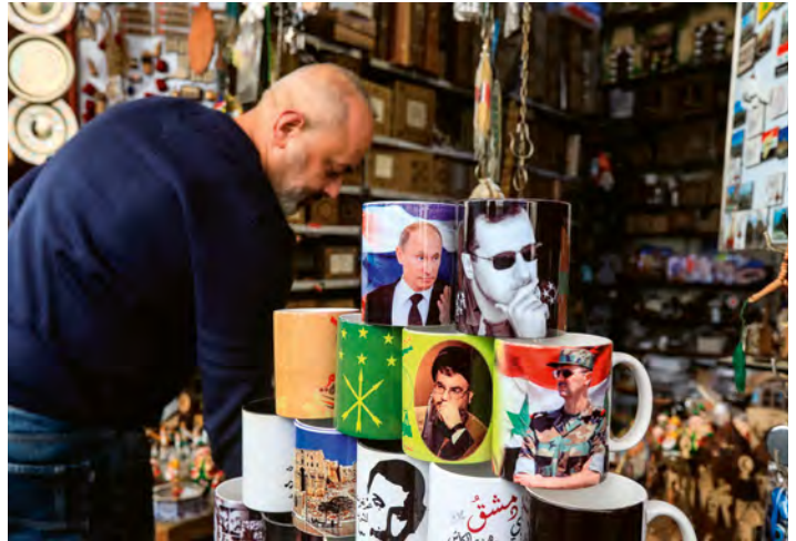
Abb. 1: Kaffeebecher als politisches Statement und Form der Heroisierung: die Allianz der »Starken Männer«. Porträts des russischen Präsidenten Putin, des syrischen Präsidenten al-Assad und des Hisbollah-Führers Nasrallah in einem Souvenirladen in der syrischen Hauptstadt Damaskus, Februar 2022.

Fig. 1: Coffee mugs representing a political statement and a form of heroization: An alliance of "strong men". This picture shows coffee mugs bearing images of Russian President Putin, Syrian President al-Assad and Hezbollah leader Nasrallah in a souvenir store in the Syrian capital of Damascus, February 2022.