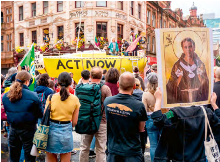
Abb. 2: Öffentlicher Protest verstärkt die Polarisierung innerhalb einer ohnehin als polarisiert empfundenen Situation. Hier blockieren Protestierende eine der Hauptverkehrsstraßen von Manchester in ihrer Forderung nach mehr Klimaschutz. Die Heroisierung Greta Thunbergs trägt zur Gemeinschaftsstiftung bei. Ein Plakat zeigt die Klimaaktivistin als Heiligen Franziskus. Fig. 2: A public protest increases polarisation in a situation that is already perceived to be very polarised. In this photo, protesters are blocking one of Manchester's main thoroughfares, demanding more climate protection. The heroization of Greta Thunberg continues to contribute to a communal cause. One poster has even replaced an image of St Francis with "St Greta".

Skepsis gegenüber Militarismus und Flaggen sehen, die sich in der jungen Bundesrepublik, vor allem im Zuge der 68er-Bewegung, einstellte. Ebenso sind Klimaaktivist:innen nur für diejenigen heroisierbar, die den Klimawandel als Tatsache akzeptieren und den Kampf gegen ihn als drängend empfinden. Für alle anderen sind sie bestenfalls Störenfriede, die die Schule schwänzen oder, schlimmer noch, den Weg zur Arbeit blockieren. In dem Maße, wie Held:innen Identifikationsfiguren einer Verehrer:innengemeinschaft sind, verfügen sie über das Potenzial, außerhalb dieser Gemeinschaft lächerlich gemacht, angegriffen oder gar dämonisiert zu werden. Und in dem Maße, in dem sie von außen angegriffen werden, können sie – zum Beispiel über Opfererzählungen – wiederum die Verehrer:innengemeinschaft stärken und einen.