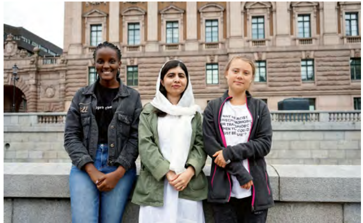
Abb. 11: »Girls' education is a climate solution« – »If girls are not allowed in schools, they can't school strike« – »Believe in science & fight for girls' right to learn it« – Slogans einer Klimademonstration, die im Juni 2022 in Stockholm stattfand. Die Gesichter dieser Aktion waren die ugandische Klimaaktivistin Vanessa Nakate, Malala Yousafzai, die aus Pakistan stammende Menschenrechtsaktivistin und jüngste Nobelpreisträgerin, und die schwedische Klimaaktivistin Greta Thunberg (von links nach rechts). Jung, weiblich, selbstbewusst, global vernetzt und überzeugt von der eigenen Botschaft – auf Gegner:innen wirkt dies provozierend.

The personal characteristics of a hero, such as gender and age, can also be polarizing factors. To return to Greta Thunberg once more: characteristics that make her appear courageous and determined in the eyes of her admirers can seem outrageous to others. A schoolgirl showed the audacity to reprimand adults – instead of attending school five days a week, as per the rules. Similar reactions were to be observed in the case of Malala Yousafzai, the young Pakistani Pashtun who was shot by the Taliban because of her activism for girls' education. The polarisation was further intensified by aspects related to identity politics. In the eyes of many Pakistani, the admiration she experienced in the Western world, including the Nobel Peace Prize she was awarded as the youngest ever recipient, and her transformation into a feminist made her an agent of American neo-colonialism – a neo-colonialism that encroached on other countries' right of self-determination under the guise of defending women's rights. In India, on the other hand, reactions to her were hostile because of her defence of women's right to wear a headscarf.