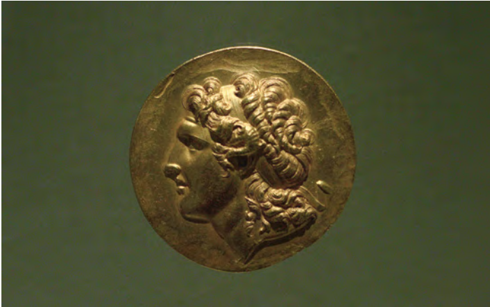
Abb. 1: Die Verehrung Alexanders des Großen (356–323 v. Chr.) überschritt viele Grenzen: Er wurde nicht nur in seiner Heimat, sondern auch dort heroisiert, wo er als Eroberer Fuß fasste. Das ägyptische Goldmedaillon zeigt ihn mehr als 500 Jahre nach der Eroberung mit der Binde des Gottes Dionysos über der Stirn und dem Widderhorn. Das Widderhorn symbolisiert, dass er von Zeus Ammon, dem Widdergott, als sein Sohn ausgerufen wurde. Insofern überschritt Alexander zudem die Grenzen des Menschlichen, indem er als Gott verehrt wurde.

Fig. 1: The veneration of Alexander the Great (356–323 BC) spanned many borders. He was not only heroized in his homeland, but wherever he established himself as a conqueror, too. More than 500 years later, this Egyptian medaillon shows him wearing a headband bearing the Greek god Dionysus and a ram's horn. The ram's horn symbolises that he was proclaimed by Zeus Ammon, the ram god, as his son. In this respect, Alexander also transcended human limitations by being worshipped as a god.