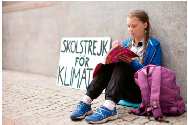
Abb. 4: Auch in Schweden besteht Schulpflicht für alle Kinder und Jugendlichen bis 16 Jahren. Als Greta Thunberg in der neunten Klasse im Jahr 2018 begann, jeden Freitag in den »Schulstreik für das Klima« zu treten, übertrat sie (bzw. übertraten ihre Eltern) dieses Gesetz. Thunberg schloss die Schule mit hervorragenden Noten ab; die von ihr inspirierte weltweite Klimabewegung Fridays for Future wird bis heute von Schüler:innen und Studierenden geprägt.

not only initiate the global youth movement Fridays for Future but also strong rejection, expressed in countless hate postings on social media. 3 The strong resonance – and polarisation – that met Thunberg’s actions also has something to do with the fact that dealing with climate change is a question weighing on many people’s minds in contemporary society. Furthermore, as a politically active young woman, Thunberg also challenges traditional perceptions of masculinity. Her actions raise questions about the shape adequate political action in the face of climate change could take. Because these are such pressing social issues, she, as an individual, can trigger a tremendous impact with the seemingly harmless transgression of a school strike. Understanding the significance of a heroic deed means considering the social context in which it takes place and not only focussing on the impressive action of the heroic figure itself.