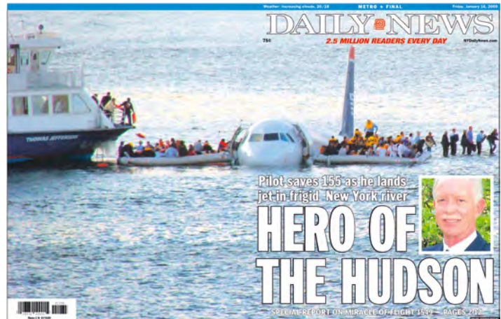
Abb. 5: Der Unterlauf des Hudson River in New York City wird von zahlreichen Brücken überspannt und ist ein vielgenutzter Wasserverkehrsweg. Notwasserungen von Flugzeugen sind so riskant, dass sie in Pilotenschulungen nicht unterrichtet werden. Nachdem die Triebwerke seines Flugzeugs ausgefallen waren, entschied sich Flugkapitän Chesley B. Sullenberger 2009 unter extremem Zeitdruck und entgegen den Anweisungen für eine Notlandung auf dem Hudson. Die sichere Landung von Flug 1549 auf dem Hudson war jedoch so außergewöhnlich, dass sie als nicht wiederholbar gilt – wahrscheinlich nicht einmal von Sullenberger selbst.

In the Sullenberger case, it was a real event and a real person. His character is labelled and celebrated as heroic by others, including the media. For real events such as this one, it is impossible to predict what the social reaction to the transgression will be. With fictional hero's tales, it is at least certain that by the end of the tale the heroes will be perceived as such – even if the story's dramatics mean that this status has to be earned first. The transgression of boundaries