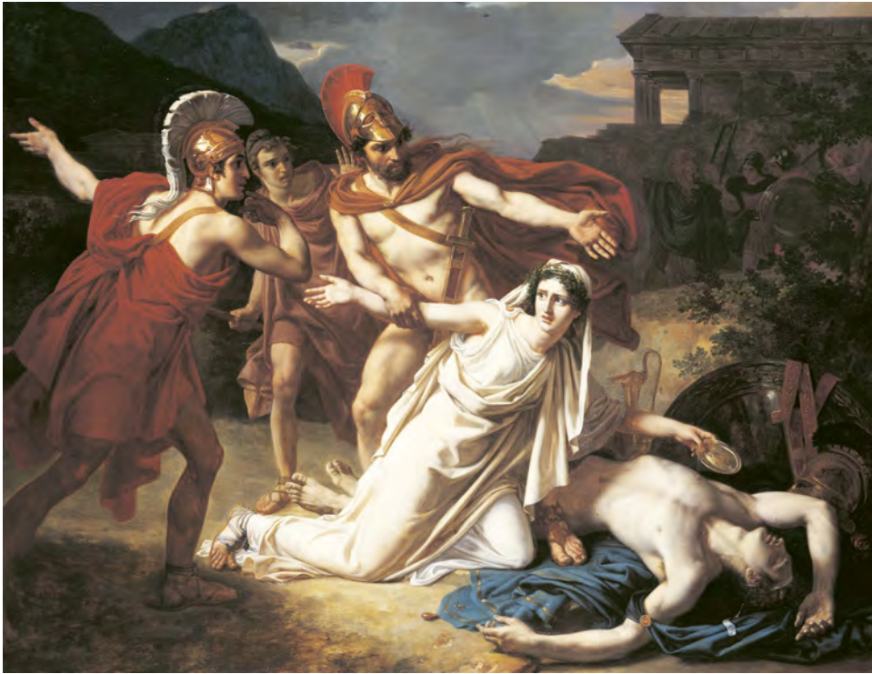
Abb. 8: Die antike Figur Antigone missachtet die weltliche Weisung des Königs, um ein göttliches Gebot zu befolgen (Gemälde von 1825). Sie nimmt dafür die Todesstrafe in Kauf. Diese heroische Grenzüberschreitung gewinnt noch an Bedeutung durch den Umstand, dass Antigone eine Frau ist. Denn Frauen hätten der Weisung des Stärkeren zu gehorchen und nicht gegen Männer aufzubegehren, so heißt es in der antiken Tragödie, die Antigones Namen trägt. Heute wird Antigone vor allem als bestärkendes Vorbild im Kampf um Menschenrechte, gegen Unterdrückung und soziale Ungleichheiten interpretiert.

Fig. 8: The ancient Greek figure Antigone disobeyed her king's secular instructions in order to fulfil a divine commandment (1825 painting). She accepted the death penalty for doing so. This heroic transgression is made even more significant by the fact that Antigone is a woman. According to the ancient tragedy that bears Antigone's name, women must obey their masters and may not rebel against men. Today, Antigone is primarily interpreted as an encouraging role model in the fight for human rights - against oppression and social inequality.