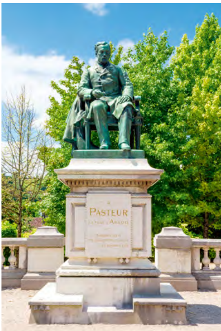
Abb. 3: Dass die meisten Helden ihre großen Taten angeblich allein und aus eigener Kraft vollbringen, wird durch Denkmäler eindrucksvoll vermittelt. So auch dasjenige für Louis Pasteur in Arbois (1901), wo er übergroß und weit über die Köpfe der Passanten hinweg in die Ferne blickt.

anderem für die Entwicklung der Pasteurisation und von Impfstoffen heroisiert und in seiner Heimat Frankreich als Nationalheld verehrt (Abb. 3). Dass seine Mitarbeiter:innen, andere Forscher:innen, die Medien und andere Faktoren seine wissenschaftlichen Experimente prägten, wird dabei ausgeblendet. 6 Komplexe Prozesse, die sich unter ganz bestimmten Bedingungen in einem Netzwerk von Einflüssen abgespielt haben, werden auf diese Weise verdichtet, vereinfacht und persona-