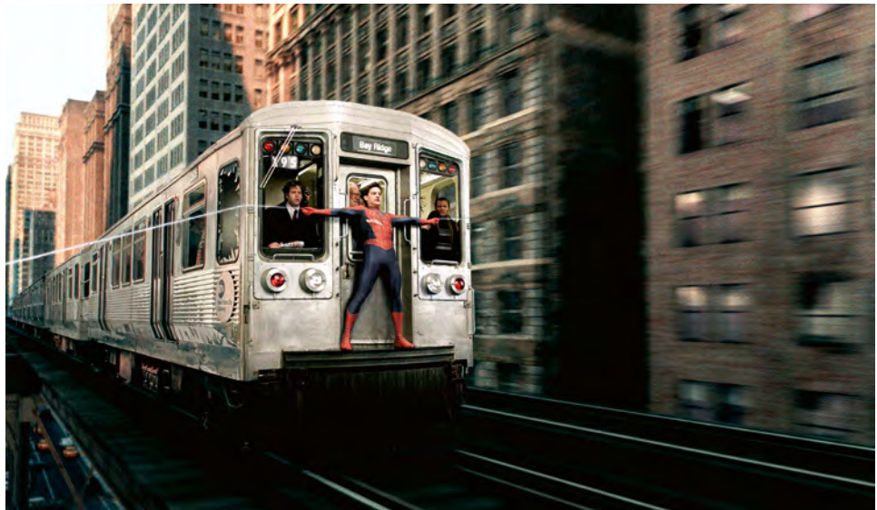
Abb. 1: Helden zeichnen sich dadurch aus, dass sie große Taten zum Wohle anderer vollbringen. Das gilt auch für fiktive Figuren wie Spider-Man, der mit seinem Körper einen Zug und die Passagiere rettet («Spider-Man 2», 2004).

Held:innen handeln. Nicht, dass andere das nicht auch tun. Aber Held:innen tun es intensiver, schneller, effektiver und vor allem wirkungsvoller und bedeutsamer. Wo andere abwarten, machen sie den ersten Schritt. Während andere zögern oder resignieren, greifen sie entschlossen zu. Woran andere zerbrechen: Das halten sie aus. Wovor viele zurückschrecken, das packen sie tatkräftig an und überschreiten dafür Grenzen. Was sie in die Hand nehmen, macht Geschichte. Kurzum: Sie sind das Gegenteil von Mittelmaß und niemals Spielball des Zufalls oder der Umstände. – So erzählen es Filme, Romane, Epen, Bilder und Berichte, der Stoff, aus dem Held:innen sind. Sie präsentieren ein vielfältiges Bild heroischer Figuren und ihrer Taten. Seien es die Opferbereitschaft der Antigone im gleichnamigen Drama von Sophokles, die Abenteuer der Superheld:innen in Action- und Science-Fiction-