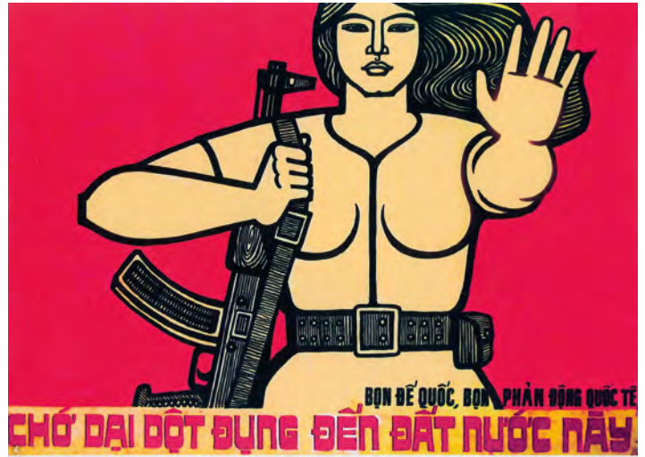
Abb. 7: Heroische Agency verkörpert sich nicht nur in Figuren, sondern kann sich auch in Attributen ausdrücken. Die Kalaschnikow, die die Kämpferinnen in den Propagandaplakaten des Vietcong tragen, steht für Wehrhaftigkeit, Stärke und Tatkraft. Das Plakat von 1977 warnt »Kolonialisten und internationale Verräter« davor, sich Vietnam aneignen zu wollen.

Agency does not necessarily have to be accompanied by the construction of a new collective identity; it can also be concentrated in an object. In the Vietnam War between the USA and North Vietnam, the Kalashnikov, for example, became a heroic symbol of the guerrilla fighters of the Vietcong. Propaganda images showed female combatants resolutely holding an “Awtomat Kalaschnokowa” in their hands. It acted as a symbol of the agency that North Vietnam had apparently gained by mobilising its entire population over the technically superior, male-dominated U.S. Army (Fig. 7). As a powerful and easy to use weapon, the “AK” was used in other guerrilla wars too, and the prominence it gained soon made it into an icon of the agency of resistance movements that were interpreted as anti-imperialistic and anti-American. As these examples illustrate, heroic agency is not only a narrative mode: it is also a visual phenomenon that is associated with ideas of self-empowerment, sovereignty and effectiveness.