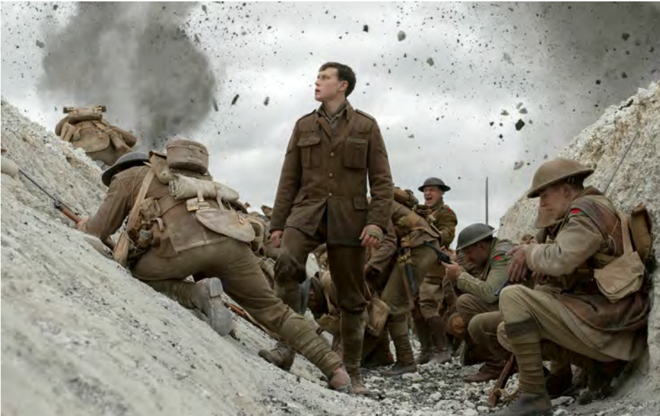
Abb. 5: Unter heroischem Handeln wird oft körperliche Aktivität verstanden. Aber auch das Ertragen einer Gefahr kann heroisiert werden: zum Beispiel im Krieg ruhig zu bleiben – wie der Protagonist im Film »1917« von 2019 – während ringsherum Chaos und Panik ausbrechen.

Knights would not be heroes without powerful enemies – neither would Antigone without the King of Thebes. Although heroic tales generally ignore many individuals and concentrate agency in one group or character, the hero's opponent marks an exception to the rule. "Apart from the heroes, they are the only ones whose agency is not toned down." 10 The polarised world of the heroes, divided as it is into friend and foe, is the habitat in which their activities grow and unfold. Nothing can be proved under harmonic conditions or when resistance is weak. If the opponent is powerful or threatening, in contrast, overcoming him is unexpected and extraordinary, that is, heroic. However, the fight, the direct confrontation with the invisible "enemy", e.g. the microbes, or the wartime enemy, is only one model of the heroic trial of strength. Agency can also be "shifted to the battle against oneself" 11 and manifest itself in the conscious endurance of a specific situation. In World War I, the