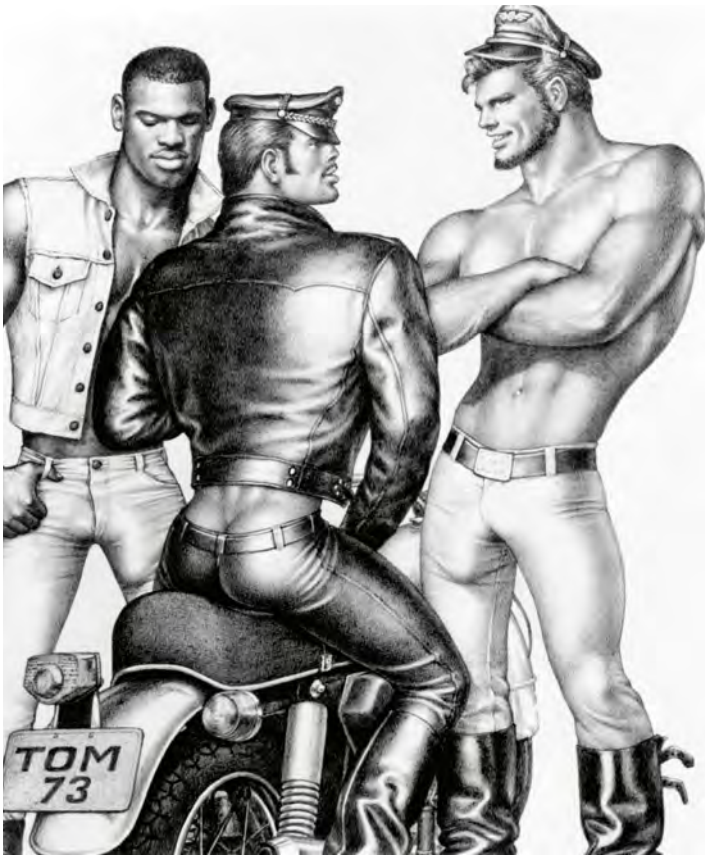
Abb. 6: Mit seinen betont maskulinen Tom of Finland-Figuren (1973) schrieb der Zeichner Touko Laaksonen Homosexuellen in einer Zeit, in der sie gesetzlich diskriminiert und stigmatisiert wurden, heroische Wirksamkeit zu.

Fig. 6: Illustrator Touko Laaksonen's emphatically masculine Tom of Finland characters (1973) attributed heroic power to homosexual individuals at a time when they were legally discriminated against and stigmatised.