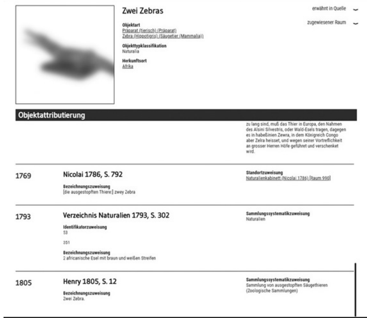
Abb. 1: Objektansicht Zwei Zebras in der virtuellen Berliner Kunstkammer.

Beim Objekt werden dann alle Informationen aus den Quellen, in denen es genannt wurde, gebündelt und chronologisch aufgelistet, sodass Veränderungen über die Zeit hinweg deutlich werden, etwa ihre Bezeichnung oder Einbettung in die Systematik der Sammlung (siehe Abb. 1). 26 Anhand solcher Veränderungen lassen sich Deutungs- und Bedeutungsverschiebungen der Objekte ablesen, die wiederum Rückschlüsse auf Veränderungen in der Sammlungspraxis und -logik ermöglichen. Auf diese Weise können neben der zeitlichen Veränderung von Eigenschaften der Objekte auch Widersprüche abgebildet und teilweise sogar aufgelöst werden. Gleichzeitig ist die Informationsprovenienz durch diesen Ansatz gesichert, da Aussagen zu den Objekten immer an ihre Quelle gebunden sind.