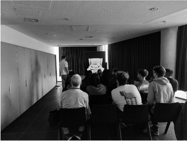
Abb. 4: Betatest, Gruppe beim Test des interaktiven Zeitzeugeninterviews.

Präsentation der digitalen Zeitzeugnisse im real-physischen Raum in Lebensgröße. Die Besucher:innen, die Schulklassen sind körperlich-real anwesend in den Räumen des Exilarchivs, in denen auch ein analoges Gespräch mit einem Zeitzeugen oder einer Zeitzeugin stattfinden könnte. Besucher:innen konsultieren bestimmte Orte, um beispielsweise Original-Gemälde und Original-Handschriften zu sehen. Die Orte sind – zumindest heute noch – mit der Erwartung verbunden, dort Authentischem zu begegnen. Das Deutsche Exilarchiv ist ein Ort, an dem Originalüberlieferungen des Exils aus der nationalsozialistischen Diktatur bewahrt und zugänglich gemacht werden. Dieser Kontext spielt für die Präsentation der digitalen Zeitzeugnisse eine wichtige Rolle, denn die Interviews werden im Rahmen einer kontextualisierenden Ausstellung präsentiert. Dort haben die Besucher:innen die Möglichkeit, sich über den historischen Kontext, die Biografien der Zeitzeug:innen und die Erstellung der digitalen Zeitzeugnisse zu informieren. Diese Ausstellung schließt an die Dauerausstellung des Exilarchivs Exil. Erfahrung und Zeugnis an, die anhand von Originalüberlieferungen aus der Sammlung den Themenkomplex Exil aus der nationalsozialistischen Diktatur erschließt.