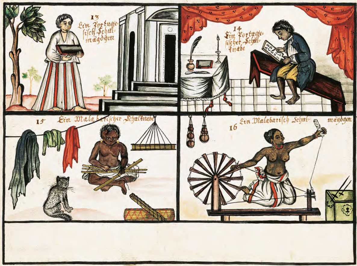
Abb. 8 Schulzenen, kolorierte Zeichnung von unbekannter Hand, im Auftrag des Missionars Nicolaus Dal, 1729 | Halle, Franckesche Stiftungen

Besucher hier ein enormes Plus an visueller Information. Für diesen Aspekt war Gründler, der naturgeschichtlich forschte und bildkünstlerisch tätig war, ohne Zweifel sensibilisiert. Ironischerweise stand ihm aber gerade für den Leopard offensichtlich keine frontalansichtige Vorlage zur Verfügung, so dass ihm dessen Physiognomie einigermaßen grimassenhaft geriet.