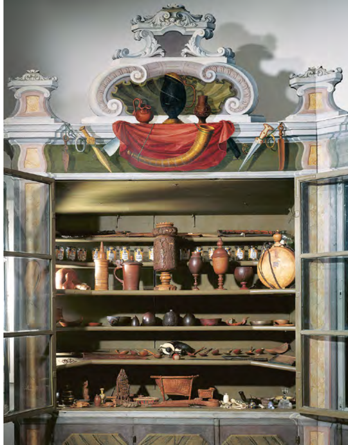
Abb. 5 Sammlungsschrank mit Alltagsgegenständen verschiedener Kulturen in der Kunst- und Naturalienkammer der Franckeschen Stiftungen zu Halle

Dominanz der in der Franckeschen Kunstkammer im 18. Jahrhundert ausgestellten raumfüllenden Modelle: Vier Modelle stellten biblische Orte und Landschaften dar. Dazu kamen ein heliozentrisches sowie ein geozentrisches Planetensystem, das noch heute erhalten ist. Sie wurden flankiert von einer Vielzahl kleinformatiger Modelle, die Gebäude der Stiftungen und verschiedene Maschinen abbildeten. Viele dieser Modelle waren detailreich gefertigt, auseinandernehmbar und zum Teil sogar beweglich, so dass sich mit ihrer Hilfe der Aufbau der Gebäude und die Mechanik der Maschinen nachvollziehen ließ. 6 Im Sammlungsraum traten sie in Konkurrenz zu den Objekten, die visuell oft weniger spektakulär und in vielen Fällen auch nicht selbsterklärend waren.