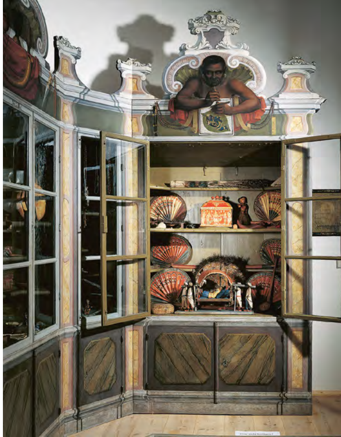
Abb. 7 Bekrönungsmalerei des Sammlungsschranks mit Objekten aus der Indischen Mission in der Kunst- und Naturalienkammer der Franckeschen Stiftungen zu Halle

Immer wieder nimmt Gründer in den Bekrönungsmalereien Bezug auf die in den Schränken gezeigten Objekte oder stellt diese sogar dar. Gerade in diesen Fällen treten die Bekrönungen in einen Dialog mit den Exponaten. Der Leopard auf dem Schrank mit den Tierpräparaten rekurriert auf eines der großformatigen, zu Beginn des entsprechenden Inventarabschnitts genannten Objekte, nämlich die, so Gründlers Text, an der Wand aufgehängte »weißlichte Tiger-Haut mit schwarzen Flecken«, 9 die aus der indischen Mission der Stiftungen im südindischen Tranquebar (heute: Tharangambadi) nach Halle gesandt worden war. Mit seiner Blickkontakt mit den Besuchern suggerierenden Darstellung des Leoparden verlebendigte Gründer das Fell, das für die Zeitgenossen vermutlich nicht ohne weiteres die Gestalt des unbekanntes Tieres evozierte. Gerade im Bereich der Zoologie, deren Präparate im 18. Jahrhundert weit entfernt von der Anschaulichkeit der sich ab dem späten 19. Jahrhundert etablierenden Dermoplastik waren, bot sich für die