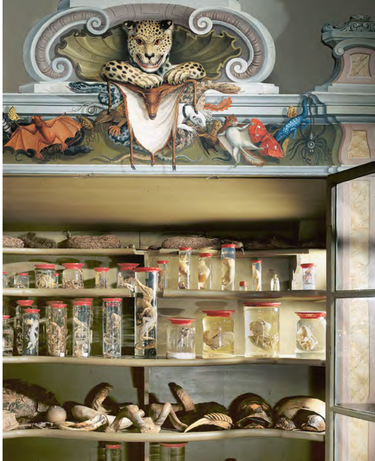
Abb. 1 Sammlungsschrank mit Tierpräparaten in der Kunst- und Naturalienkammer der Franckeschen Stiftungen zu Halle | Halle, Franckesche Stiftungen, Foto: Klaus E. Göltz

der Vitrinenteil sowie die bemalte Bekrönung. Dies entspricht der in den Naturalienkabinetten der Zeit üblichen, tabellenhaften Präsentationsform, die angesichts neuer Klassifikationssysteme auf die schnelle Erfassbarkeit von Objektreihen zielte. 3 Vermutlich bildete die in dieser Sammlung sehr früh eingeführte Linnésche Taxonomie die Basis, um dem gesamten Sammlungsraum eine klassifikatorische Organisation zu verleihen: Jeder Schrank entspricht einem Ordnungssegment. Die auf den Vitrinentüren unterhalb der Bekrönung aufgebrachte alphanumerische Kennzeichnung geht auf das von Gründer zur selben Zeit erstellte Inventar zurück und erlaubt eine rasche Orientierung innerhalb der Systematik. 4