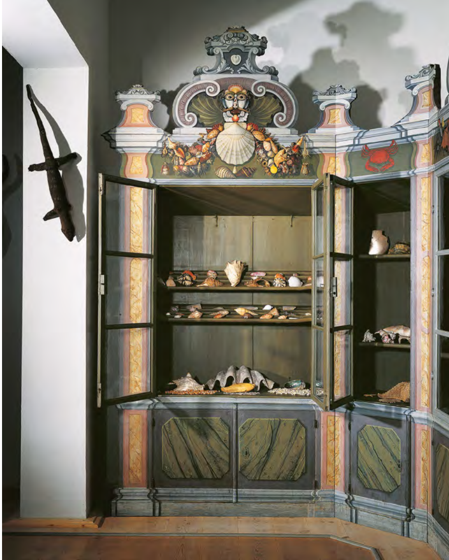
Abb. 3 Sammlungsschrank mit Conchylien in der Kunst- und Naturalienkammer der Franckeschen Stiftungen zu Halle | Halle, Franckesche Stiftungen

auf Gründlers Schrank mit Alltagsgegenständen in der Mitte ein Trinkhorn platziert – wie in der Kopenhagener Vignette zu den Altertümern. Aus den Fledermäusen auf der Vignette zu den avibus werden bei Gründler, physiognomisch ähnlich, Flughund und Gleithörnchen auf dem Schrank mit Tierpräparaten, aus der japanischen Rüstung der Vignette zu den Ethnographica auf dem Schrank zu den Textilien ein türkischer Habit.