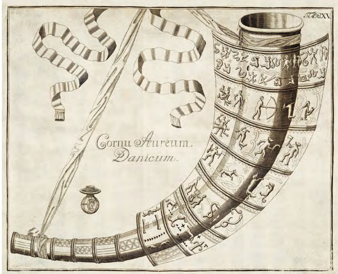
Abb. 6 Das Horn von Gallehus, Illustration aus: Holger Jacobaeus, Museum Regium , Kopenhagen 1696, Tafel 15 | Staatsbibliothek Bamberg, H.l.f. 29, Foto: Gerald Raab

Motiv des Gesichtes sprechen sie den Betrachter unmittelbar affektiv an. Ihre mit großer Plastizität und suggestivem Schattenwurf fast trompe l'oeil -haften Kompositionen stellen die Objekthaftigkeit im Bild heraus. In diesem Sinne wird aus der Vorlage des Horns von Gallehus aus dem Museum Regium die Gegenständlichkeit und schematische Wiedergabe kombiniert, auf der Bekrönung ein dreidimensionales Objektporträt, dessen visuelle Plausibilität Gründer durch den das Horn hinterfangenden roten Stoff intensiviert (siehe Abb. 5 und 6). In besonderem Maße nutzte er diesen Effekt im Fall des Schrankes zu der geologischen Sammlung, indem er der Farbe beigemischte Mineralienpartikel zur haptischen Akzentuierung der Gesteine verwendete. 8 Auf diese Weise gewannen die Objekte auf den Bekrönungen im Medium der bildlichen und im Raum über Augenhöhe prononciert platzierten Darstellung eine enorme visuelle Präsenz.