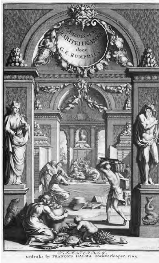
Abb. 4 Frontispiz zu Georg Eberhard Rumpf, D'Amboinsche Rariteitkamer, Amsterdam 1705 | SUB Göttingen, GR 2 H NAT III, 6935

die Bilder Arcimboldos, die Gründer über den Umweg des Kataloges der Gottorfer Kunstkammer rezipiert haben könnte. Entscheidender war jedoch sicher das Frontispiz zu Georg Eberhard Rumpfs D'Amboinsche Rariteitkamer (1705), auf die er sich im Inventar wiederholt bezieht (siehe Abb. 3 und 4). 5 In der Kombination dieser Gestaltungsmittel entsteht ein Spiel aus anthropomorpher Verlebendigung und Objekthaftigkeit, Einheitlichkeit und Varianz. Auf diese Weise wird Gründlers Bildprogramm zu einem Instrument der Gliederung der Sammlungsordnung, das zugleich deren Memorierbarkeit erleichtert.