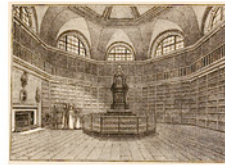
Abb. 3: Spuren von Provenienz und Nutzung in der dreidimensionalen Ansicht der Buchbände eines mehrbändigen Werkes, Antiquariat Müller & Draheim: Bibliognosts &c. Catalogue 23, Ausschnitt Beschreibung Lot 3: (Barnard Frederick Augusta), Bibliothecae Regiae Catalogus , 5 vol., London 1820–29.

A large, uncut set on thick Whatman paper in its first, but very worn bindings: Most hinges broken, five covers detached (with a tear at gutter of first half-title). Spine material preserved almost complete, but one half only in situ , the rest in loose strips. Mild browning and foxing to first and last leaves, stronger to the portraits; else crisp.