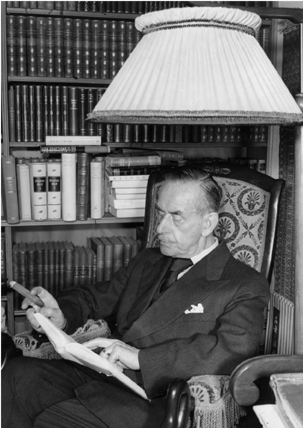
Abb. 3: Thomas Mann im Schwanenfaueteuil vor seiner Bibliothek, lesend. Erlenbach am 22. Januar 1954, © ETH-Bibliothek Zürich, Thomas-Mann-Archiv, TMA_3538 (Photo: Photopress).

Bücher; sie zeigen literarische Wahlverwandtschaften in Gegenwart und Geschichte.