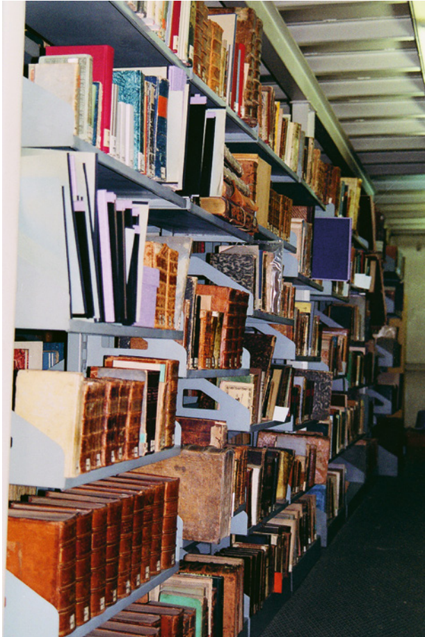
Abb. 3: Lagerung der Arnim-Bibliothek im ›Stahlmagazin‹ der Herzogin Anna Amalia Bibliothek, Schlosskapelle Weimar, historische Aufnahme aus dem Jahr 1998.

Aufstellung der Bücher erfolgte »in der Ordnung [...], in der sie auch in Wierpersdorf gestanden hatten«, 35 wobei die bei der ersten Katalogisierung 1929 aufgefallenen Widersprüche 36 vermutlich nicht revidiert wurden. Während